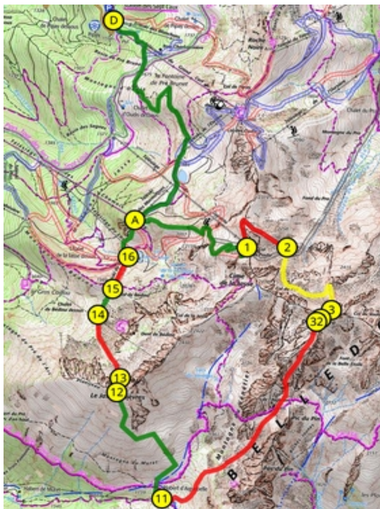
Arrivée en altitude (retour au départ neutralisé)

Parcours B U20 hommes (officiel) et Sub21 (non officiel)